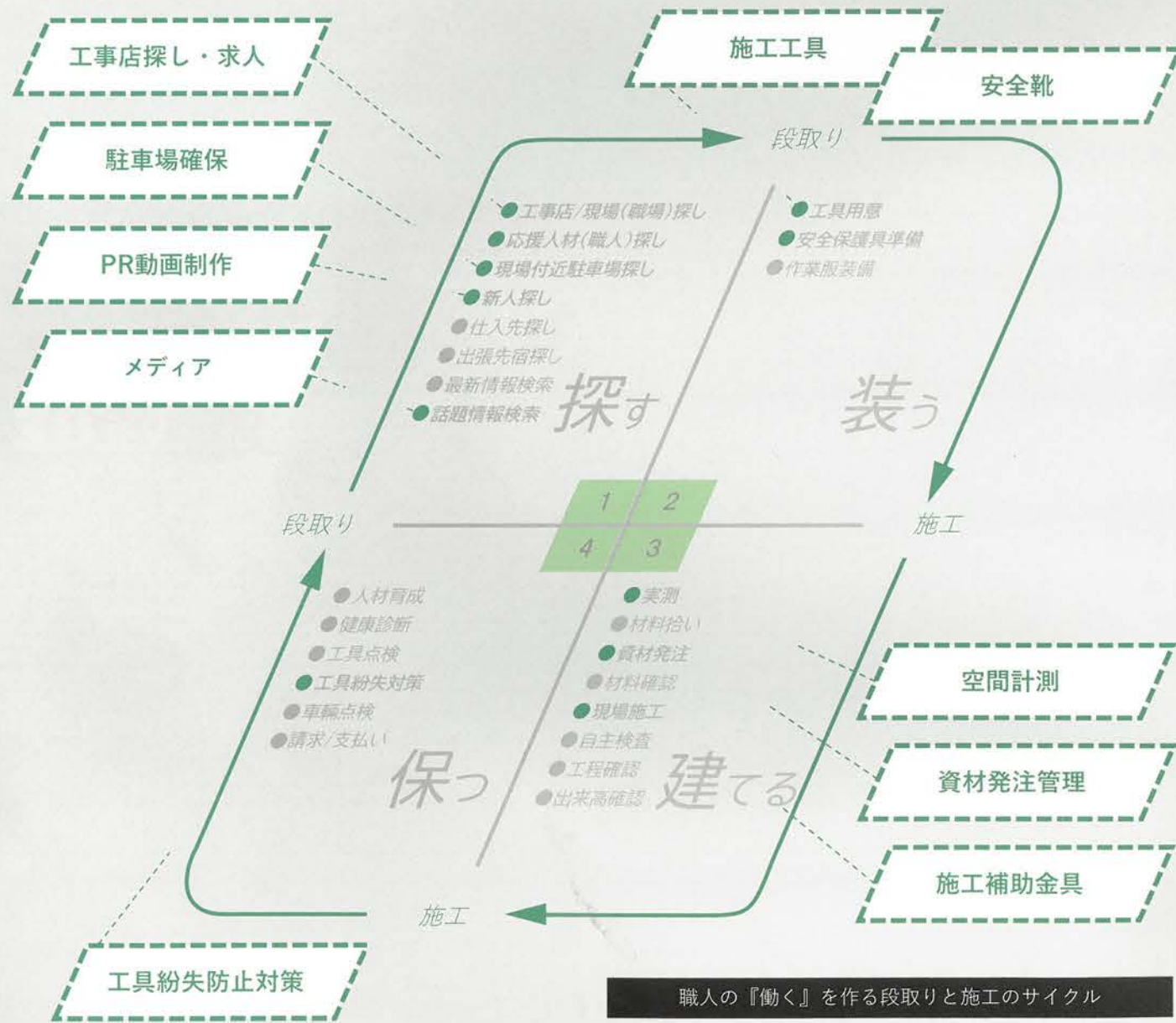
職人の『働く』を作る段取りと施工のサイクル

日々現場で工事を行っている職人さんのワークサイクルには、現場作業以外にも複数の煩雑な作業が隣接しています。今回は、その『働く』を『段取り』と『施工』のサイクルに振り分け、各活動の中に効果を発揮するテクノロジーや、あまり知られていない商品などを紹介していきます。